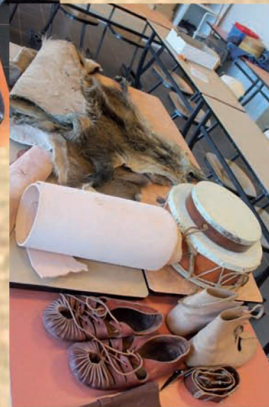
Divers objets reconstitués d'après des fouilles archéologiques.