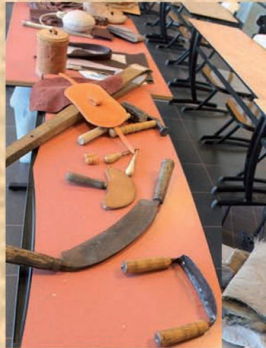
Outils de tannage et travail du cuir.

Ils pourront également découvrir les outils utilisés pour le travail du cuir lors d'une démonstration, mais aussi toucher des fourrures tout en essayant de deviner à quels animaux elles appartiennent.